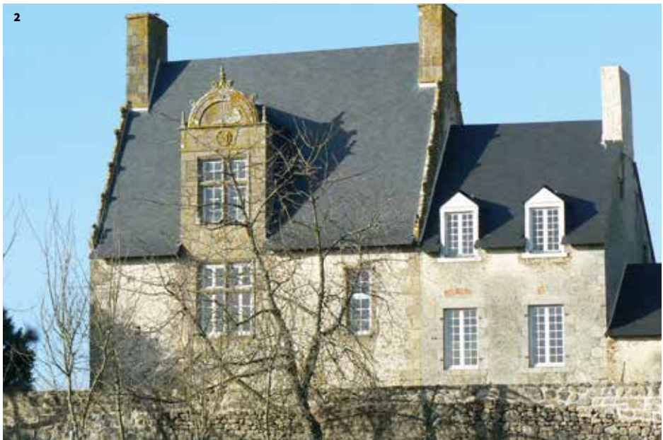
2. L'ancien presbytère, 16 e siècle