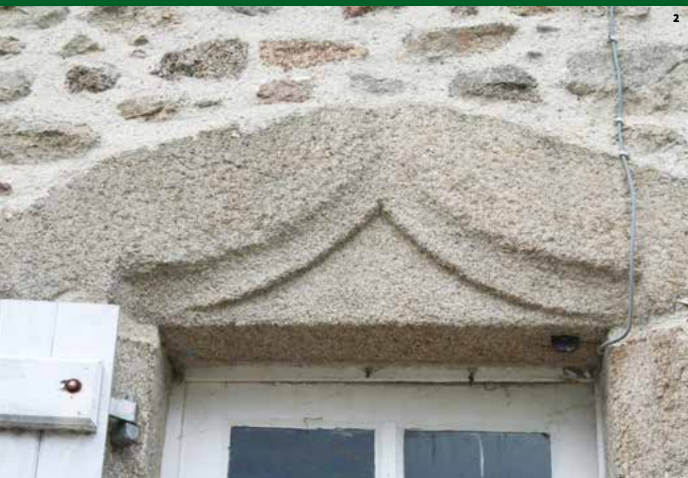
2. Ancien bâtiment de ferme face à l'église, détail