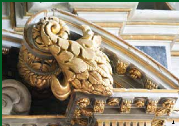
1. Retable du maître-autel, détail