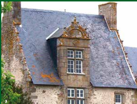
3. Ancien presbytère, baie Renaissance