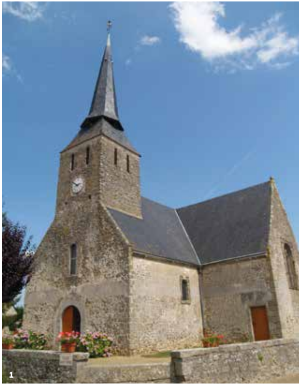
1. L'église Saint-Pierre