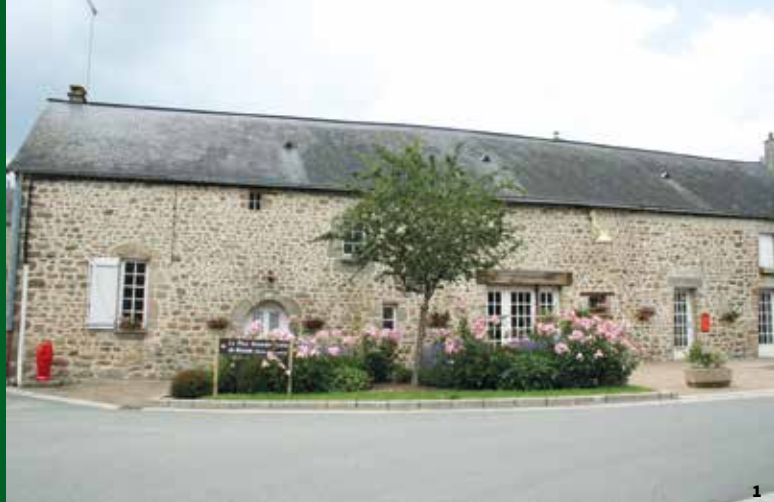
1. Ancien bâtiment de ferme dont la partie gauche pourrait remonter au 16 e siècle